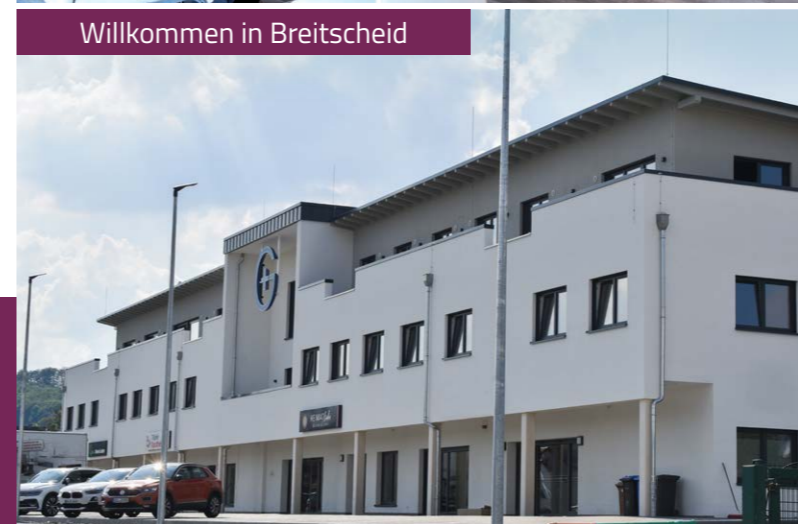
Willkommen in Breitscheid