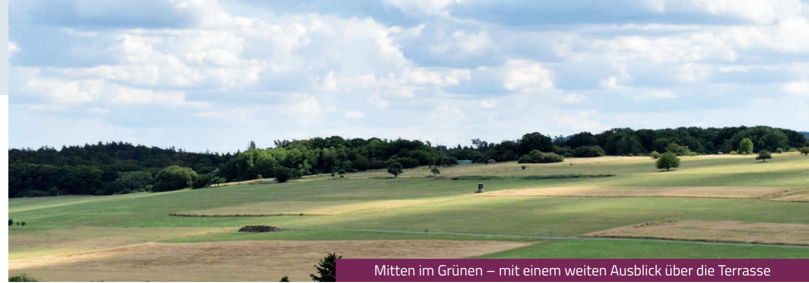
Mitten im Grünen – mit einem weiten Ausblick über die Terrasse

Unsere Intensivpflege-WG mit ihren großzügigen, ansprechenden Räumlichkeiten ist eine echte Alternative zum Pflegeheim – für mehr Lebensqualität und Zuversicht.