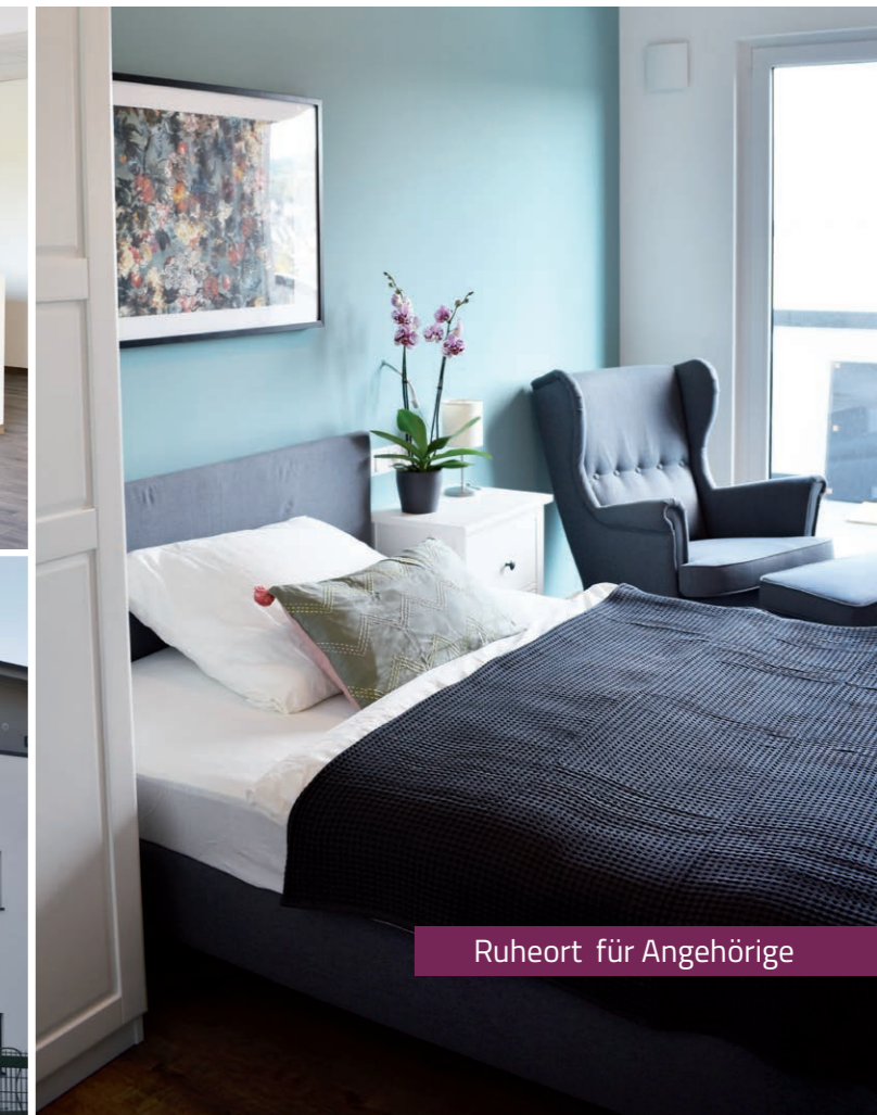
Ruheort für Angehörige