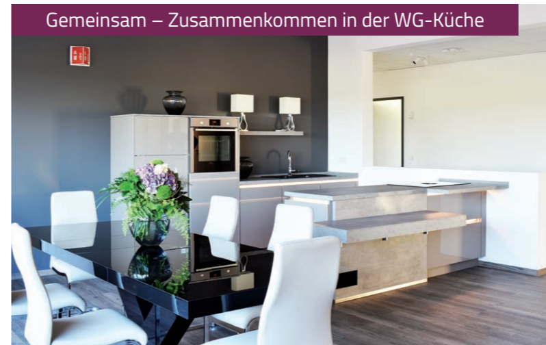
Gemeinsam – Zusammenkommen in der WG-Küche